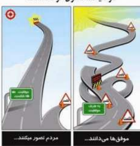
مردم تصور میکنند...

«سارق مسلح، موفق به فرار شد.» یا «فلان قاتل یا جنایت کار موفق شد از زندان بگریزد.» عملی خلاف کاران نیز، با اقدام، حرکت و عکس حتمی به موفق و حساب شده، در کار و هدف خود موفق می شوند. در اینجا بحث ما خوب یا بد بودن هدف نیست، بلکه اهمیت، تاثیر و کاربرد عنصر «حرکت و اقدام کردن» را می گوئیم. نکته این است که مجرم نیز، یا به کار بردن این عنصر به هدف و خواسته ی خود می رسد. ساکنان و عرفایی این حرکت می کنند و به درجات بالایی از ایمان و معنویت می رسند، برای رسیدن به آن هدف یعنی همان رشد معنوی، تصمیم می گیرند و یک برنامه منظم، مداوم و دقیق را در قالب ریاضات های طاقت فرسا اجرا می کنند تا به خواسته خود رسیدن. پس حرکت گزینی و سکوت و سکون های عرفا هم در واقع نوعی تصمیم و اقدام کردن است و سکوت آنها، یک سکوت هدفمند و با برنامه برای رسیدن به یک هدف خاص یعنی دستیابی به درجات بالایی معنویت است. این با سکون و بی تحرکی که بنیانش سستی و بی حالی است، متفاوت می باشد. بنابراین موفقیت در رسیدن به هدف و خواسته ی خوب یا بد، محصول عمل گزایی و اقدام کردن است. این اقدامات هرچه قدر دقیق و به موقع، حساب شده با برنامه ریزی و به هر میزانی باشد، به همان اندازه موفقیت حاصل می شود. در شاهراه و اتوبان موفقیت، حتی اگر لاک پشت را حرکت کنید، در نهایت به مقصدی خواهید رسید هر چند به کنده ای چرا که در اتوبان موفقیت، رقیبان شما با اقدام به موقع و سرعت از مزو، زورخانه، قهقهه و ماهه از شما قاصم می گیرند و فرصت‌ها و موفقیت های مالی، شغلی، تحصیلی، عشقی و حتی معنوی را خیلی قبل تر از شما می ربایند. در شماره بعد ادامه این بحث را پیگیری نمایید.