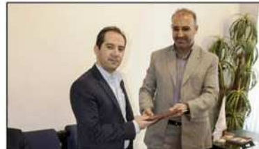
مدیر شعب بانک مسکن استان کرمانشاه

رئیس اداره روابط عمومی و مسئولین واحد خزانه داری مخابرات منطقه کرمانشاه با حضور در محل شرکت به پرداخت ملت از خدمات این شرکت تقدیر به عمل آوردند. شرکت به پرداخت ملت از شرکت های زیر مجموعه بانک ملت می باشد که در امر خدمت رسانی به مشتریان مخابرات و دستگاه های که در دفاتر خدمات ارتباطی فعالیت دارند خدمات خوب و همگامی مناسبی با مخابرات منطقه کرمانشاه داشته است. آشنکاری رئیس روابط عمومی مخابرات ضمن قدر دانی از زحمات مجموعه شرکت به پرداخت ملت از امداد برای آن در این مخابرات ها تشکر و قدردانی نمود و خدمات بهتر با کیفیت بالاتری به مشتریان مخابرات ارائه داد. شرکت به پرداخت ملت از اهداف لوید و تحولات و هدایایی از کارکنان شرکت (به پرداخت ملت) تقدیر شد.